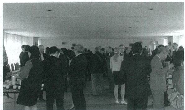
国際色豊かなランチタイムの会場。