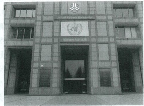
会場の「国連大学本部」正面入口。