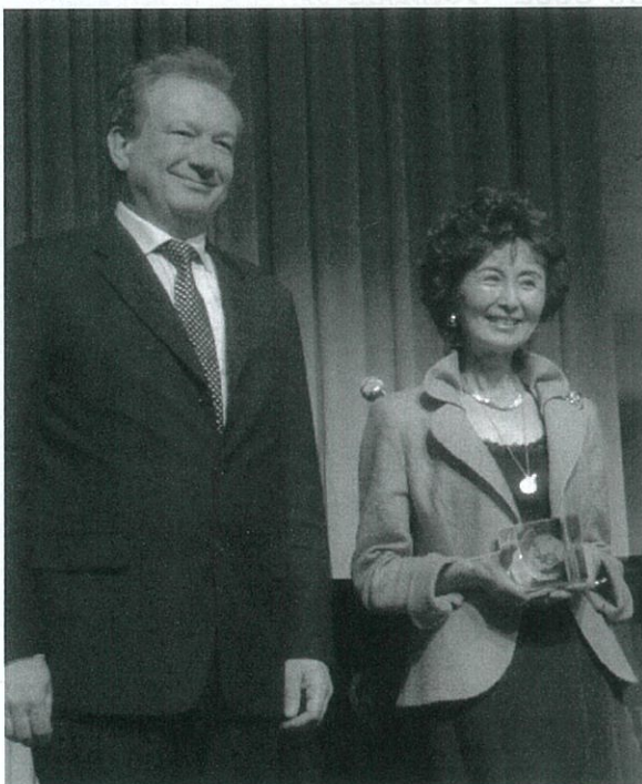
キャンベル博士の代理としてトロフィーを受け取る。