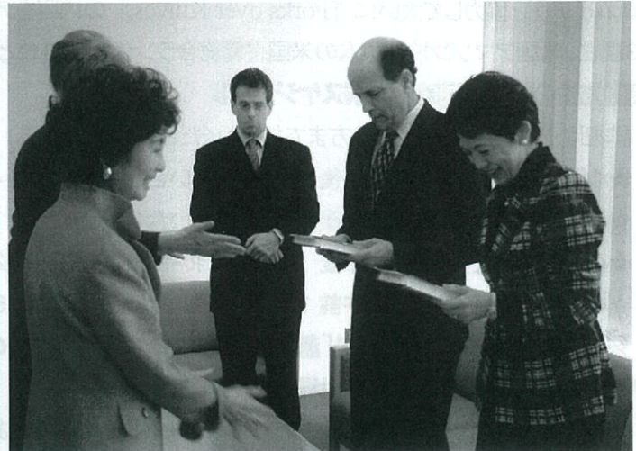
高円宮妃殿下とルース駐日米国大使に 『葬られた「第二のマクガバン報告」』を献呈。